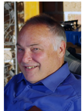
Heinz Lennartz Layout