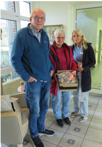
Besuch der Sternsinger