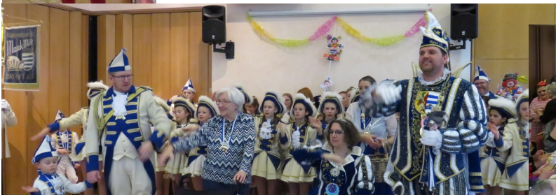
Brempter Karnevalsgesellschaft „Maak Möt“: